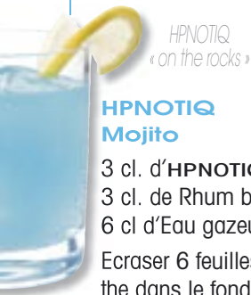
HPNOTIQ « on the rocks »

Ajouter des glaçons et agiter dans un shaker. Verser dans un verre à cocktails. Garnir d'une Tranche de citron.