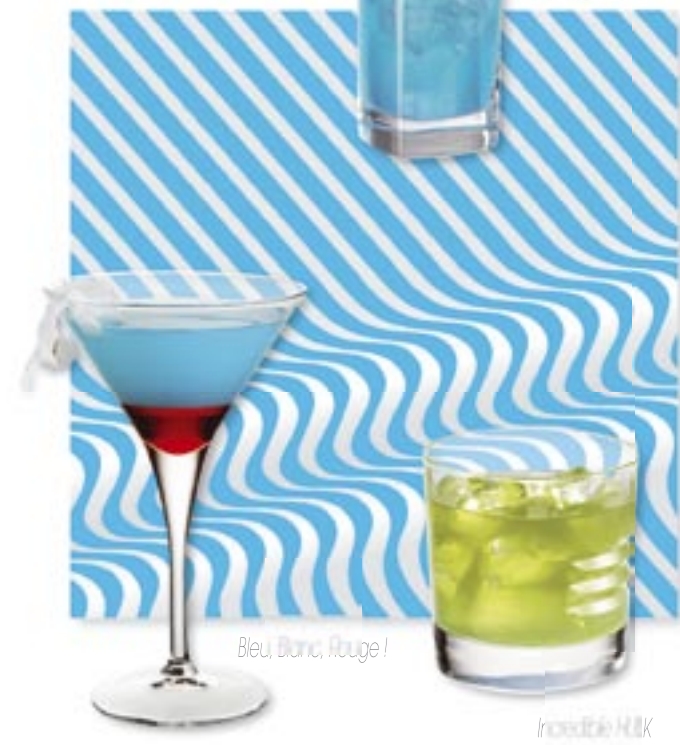
Bleu, Blanc, Rouge !

Ajouter des glaçons et mélanger dans un shaker. Verser dans un verre à cocktails. Garnir d'une tranche de carambole.